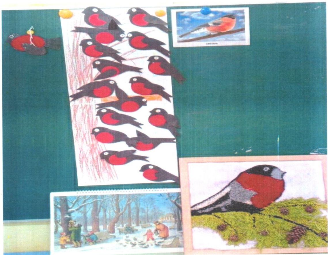
Аппликация «Снегири на деревьях»