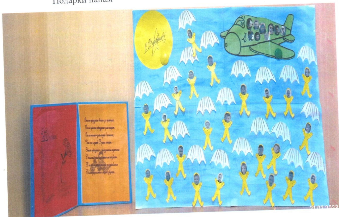
Стенгазета. Коллективная работа