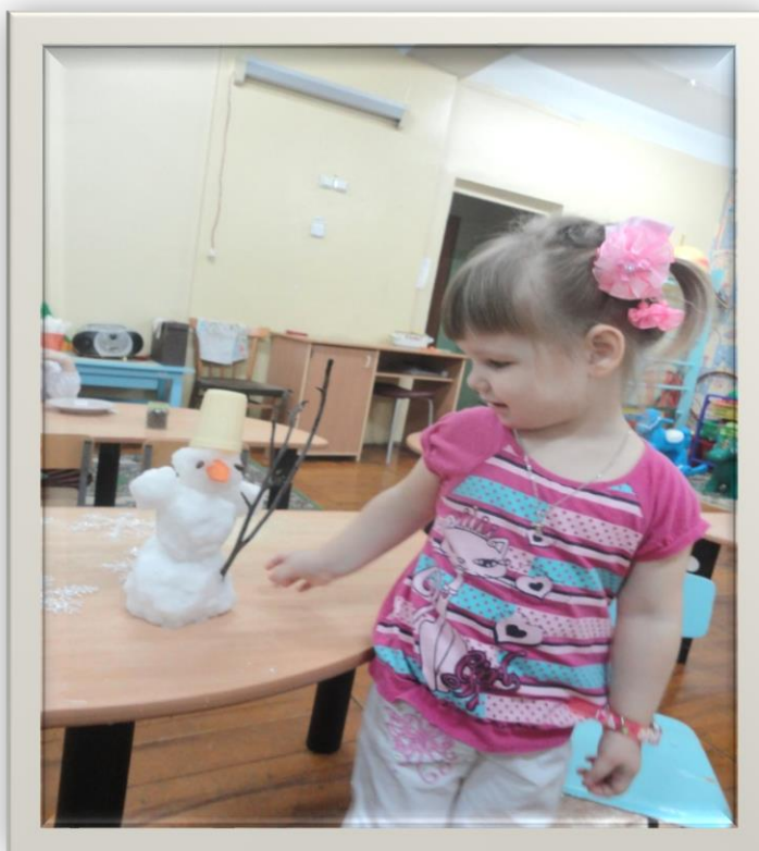
« Вот какой Снеговик у нас получился»