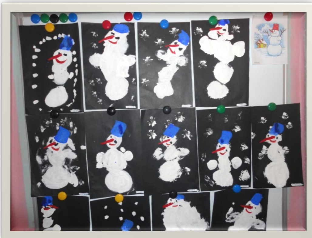
Выставка детских рисунков «А у нашего двора снеговик стоял с утра»