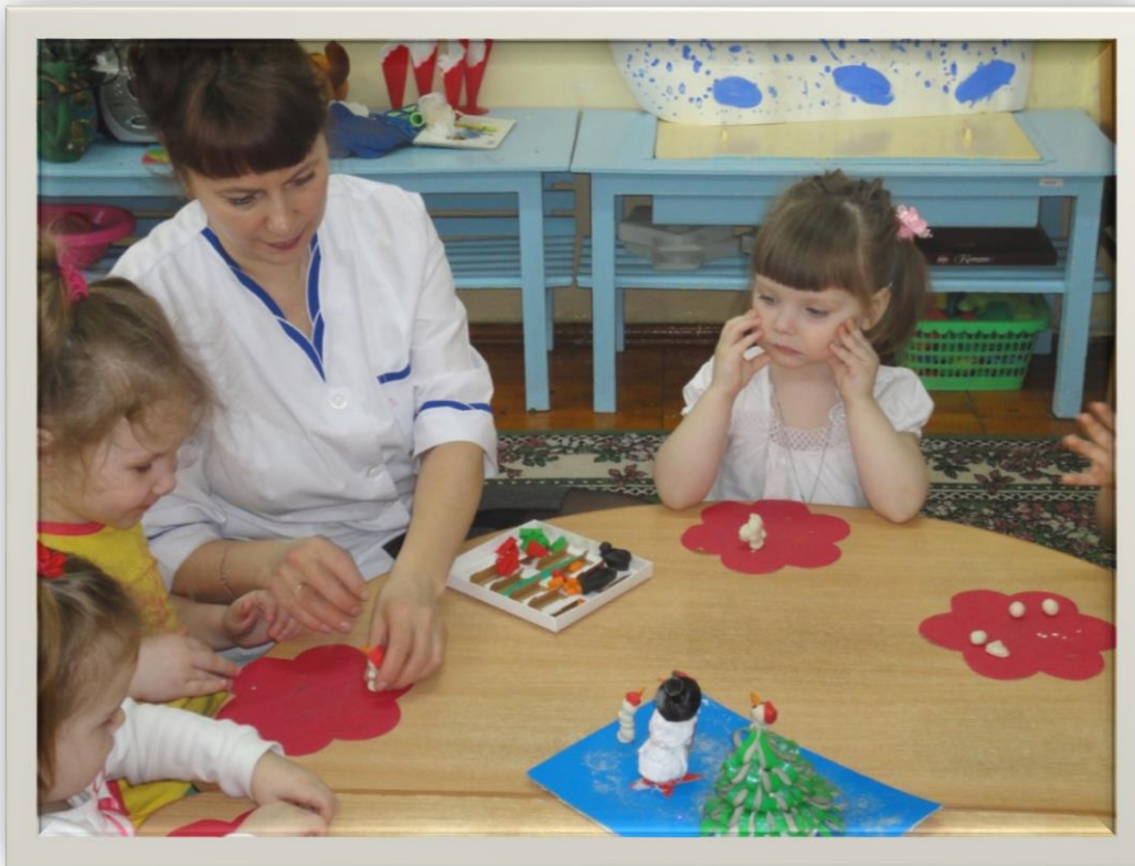
Лепка « Снеговик»