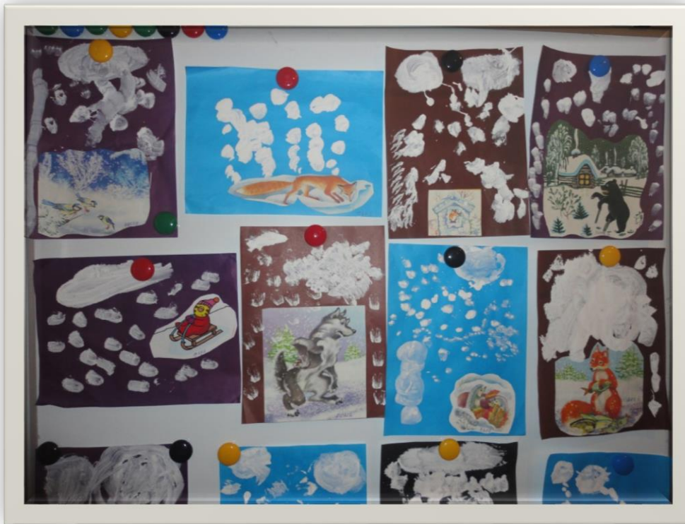
Рисование. «Дорисуй картинку -Снегопад».