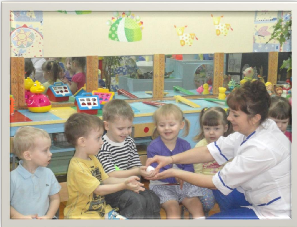
«Какие холодные снежные комочки!»